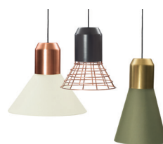
BELL LIGHT PENDANT LAMP 2013