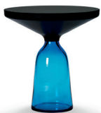
BELL SIDE TABLE 2012